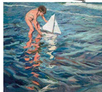
● "El balandrito", Joaquín Sorolla.